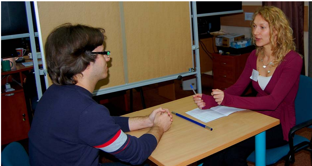
A hallgatók kezükben veszik a dolgokat: interjúkészítési helyzetgyakorlat Lengyelországban, 2010 áprilisában.

Noha a privát és a nyilvánosságnak szánt beszéd megkülönböztetésének pontos felismerése az oktatás egyik céljai között szerepel, ezt a képességet általában nem lehet kizárólag a megismerési folyamat útján elsajátítani. Az oktató olykor-olykor elhangzó figyelmeztetése, hogy a „világ hallgathatja, láthatja, amit mondsz” nem helyettesítheti a gyakorlati feladatokat és a többi hallgatótól érkező visszajelzéseket. Ennélfogva valamennyi a kurzus alatt készített interjút le kell játszani, meg kell hallgatni és meg kell vitatni a csoporton belül. A visszajátszáshoz használjunk jó minőségű hangszórókat, melyek a nyilvánosság felé való közlés benyomását keltik, garantálják a hanghűséget és ezzel a beszélők magabiztosságát növelik.